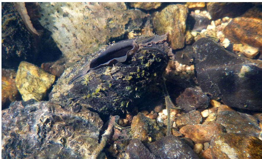
Jedna z posledních dospělých perlorodek ve svém přirozeném prostředí.

programu byla zahájena již v roce 1993 a aktuálně probíhá etapa třetí, která byla schválena koncem roku 2013. Aktivní ochranná opatření jsou zaměřena nejen na druh samotný, ale především směřují ke zlepšení stavu jeho biotopu. Toto tzv. ekosystémové pojetí záchranného programu považuje za klíčové zlepšení kvality vody a cílí také na přilehlé terestrické biotopy s úzkou vazbou na vodní prostředí perlorodkových toků. Za biotop je nutno považovat celé povodí, proto jsou opatření většinou plošně rozsáhlá a tím i nákladná.