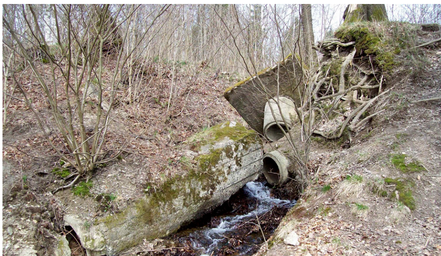
Obtok Dolíšky, Rokytnice.

hydrologických, pedologických a biologických poměrů v povodí. V dotčených územích je ovšem nutné zohledňovat nejen odborné požadavky ochrany přírody, ale také zájmy všech hospodařících subjektů a vlastníků půdy, které jsou mnohdy, stejně jako finanční prostředky státní ochrany přírody, limitující. Rozdělení vlastnických práv k pozemkům se navíc za minulá desetiletí