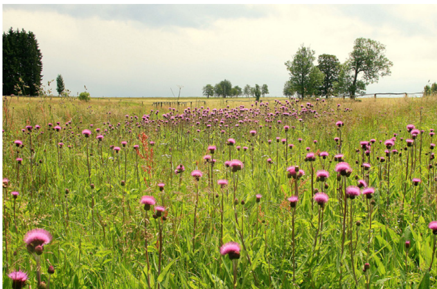
Vlhká pcháčová louka v povodí Rokytnice.

Pro zlepšení možností přenosu perlorodek pomocí jejich hostitelů – lososovitých ryb – a obnovení přirozeného reprodukčního cyklu je na Rokytnici dále navrženo odstranění některých migračních překážek v tocích. V tomto ohledu je asi nejproblematičtější překonání hráze rybníku Dolíška. První výsledky bioindikačních pokusů ukazují mimořádně vhodné prostředí pro perlorodky v úseku Rokytnice, který je však pro ryby neprostupně oddělen vysokou hrází rybníka. Zde je navržen bypass, složitě překonávající značný výškový rozdíl, starou navážku a silnici. Pozitivně se projevuje i spolupráce s místní organizací Českého rybářského svazu, která v povodí podporuje odchov pstruha obecného a výhradně využívá genofond lokální populace a zlepšení migrační prostupnosti je jednoznačným přínosem i pro jejich aktivity. Návrhy opatření jsme v obou povodích představili všem vlastníkům a správcům pozemků, obcím a institucím, jejichž práva by mohla být revitalizací dotčena. V tento moment se projevil značný rozdíl v přístupu majoritních vlastníků v obou povodích. Zatímco na jihu Čech je návrh chápán pozitivně, v Ašském výběžku jsme se setkali se striktním nesouhlasem. Pro vlastníka zemědělských pozemků v povodí