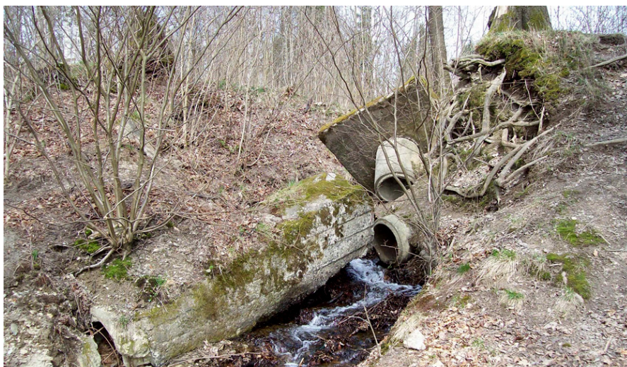
Obtok Dolíšky, Rokytnice.

hydrologických, pedologických a biologických poměrů v povodí. V dotčených územích je ovšem nutné zohledňovat nejen odborné požadavky ochrany přírody, ale také zájmy všech hospodařících subjektů a vlastníků půdy, které jsou mnohdy, stejně jako finanční prostředky státní ochrany přírody, limitující. Rozdělení vlastnických práv k pozemkům se navíc za minulá desetiletí